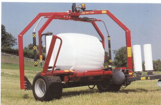
Vicon BW 1700 – bogserad inplastare

ELMIA Kom till ELMIA och se, upplev och informera dig om våra nya redskap!