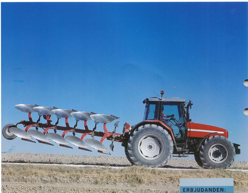
MF 6200 – ett lyft för dina redskap.