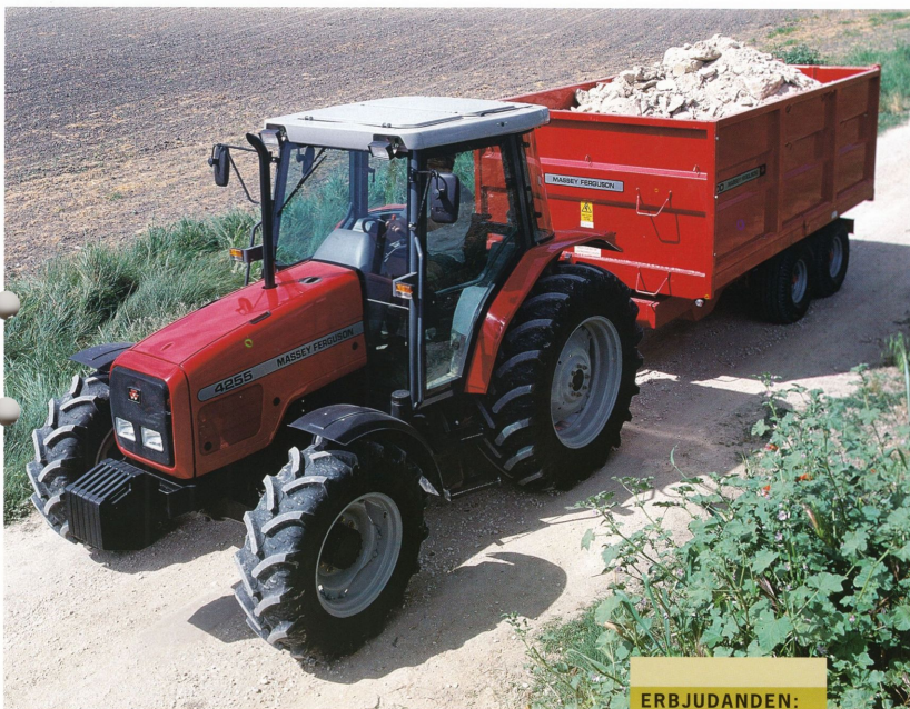
Rappa 4255 – på väg mot nya tag.