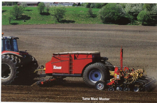
Tume Maxi Master

Tume Maxi Master finns i olika utföranden: välj mellan fyra och sex meters arbetsbredd, 3 400 eller 5 500 l behållarvolym, kombi- eller såmaskin, rak- eller laserbill. Besök oss så får du veta mer!