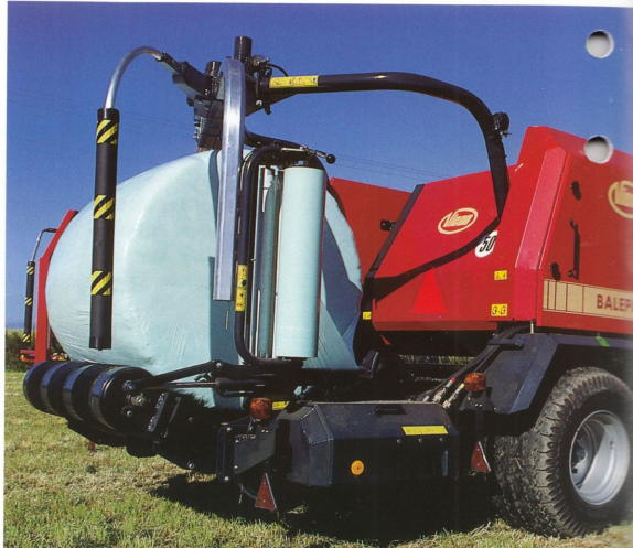
Vicon RF 130 Balepack – press och inplastare i ett.

Vicon RF 130 Balepack är en ny rundbalspress med integrerad inplastare. Chassit utgörs av en kraftig 7,6 tons boggieaxel där en Vicon RF 130 rundbalspress med snittaggregat, samt en inplastare med dubbla satellitarmar, är placerad. Med denna konstruktion får man fodret snittat, pressat och inplastat i en följd, vilket minimerar tiden mellan pressning och inplastning av ensilage. Vicon RF 130 Balepack har alla RF 130-prensens fördelar med bred insamlingspickup, integralinmatning, ett välbeprövat snittverk och nättindning som standard. Inplastaren är av dubbel satellitmodell med tre st band och två st stödrullar och försträckare för 750 mm film i aluminium. Inplastaren är tillverkad av Kverneland i Norge.